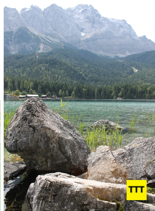
Blick auf den Eibsee und die Zugspitze.