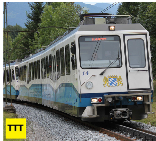
Am Wegesrand: Die Zugspitz-Zahnradbahn