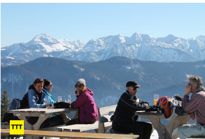
Dem Himmel nah: Brotzeit an der Florihütte bei blauem Himmel und strahlendem Sonnenschein vor imposanter Bergkulisse.

intelligent ausgeknobelten gut beschilderte und von Tourengern eingetretene Route, die unweit der Skipiste bergauf führt, erreicht kaum einmal Steigungen von mehr als 30 Prozent. Nach höchstens zwei Stunden genussreicher Wanderung erreichen wir unser Etappenziel, die Florihütte. Und nach einer Brotzeit vor traumhaft schöner Bergkulisse ergreift uns doch ein wenig Neid: Die Skitourengerer rauschen nun nach ein paar Stockschüben auf präparierter Piste Richtung Tal. Wir hingegen marschieren auf Schneeschuhen noch einmal etwa eine Stunde talwärts — auch schön.