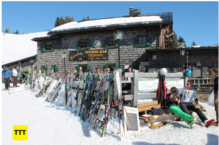
Beliebter Treffpunkt für Skifahrer und Tourengerer: Die Terrasse der Florihütte.

Unweit des Parkschein-Automaten ist eine gute Einstiegstelle. Wir stapfen auf dem zunächst nur leicht ansteigenden Hang bergauf, lassen Skischule Lenggries und Draxlhütte rechts liegen und erreichen bald unweit des Milchhäusls einen Steg über den Murbach, den wir überqueren. Nun beginnt der eigentliche Anstieg, der allerdings mehr Freude als Schrecken verbreitet. Die