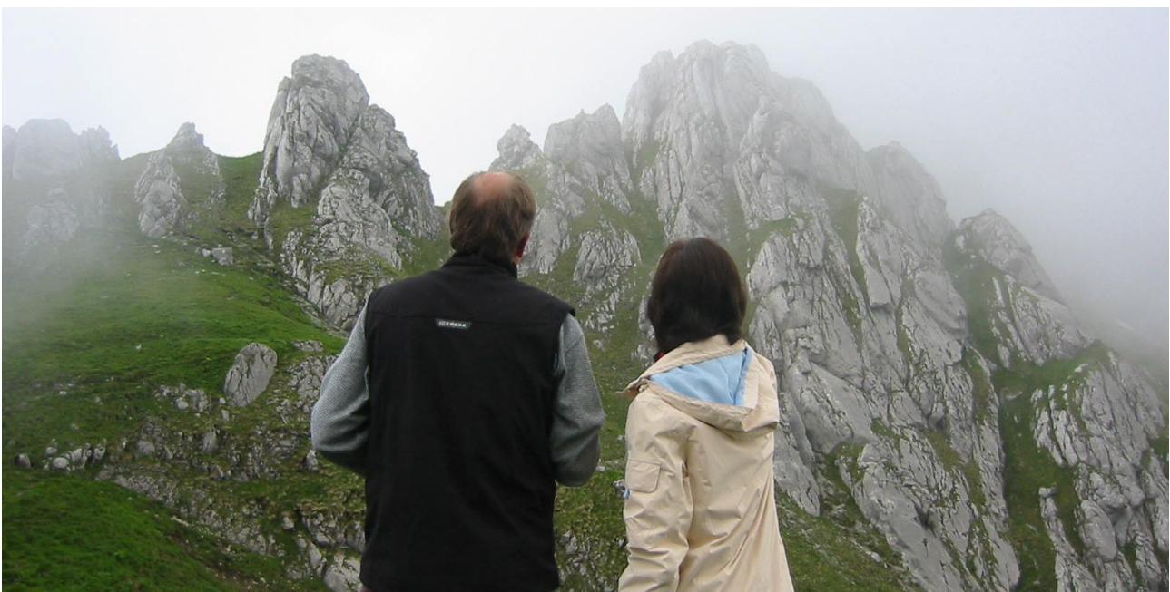
Der Blick von der Torscharte hinauf zum Torkopf, wo man Gämsen und Murmeltiere beobachten kann.