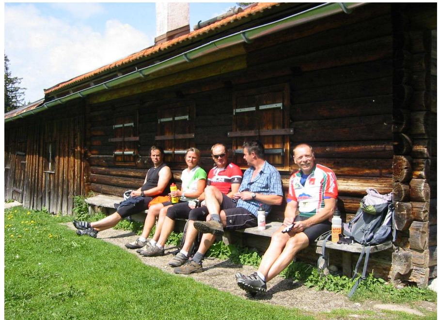
Der Lohn der Mühen: Eine behagliche Rast auf dem Bankerl an der Schwaigeralm (oben) und ein schöner Blick hinunter nach Gaißach und Bad Tölz (unten).

Zweimal im Jahr herrscht Hochbetrieb auf der (nicht bewirtschafteten) Schwaigeralm am Rechelkopf: Beim Berglauf des SC Gaißach und beim Mountainbike-Rennen der Radsportfreunde. Doch irgendjemand ist eigentlich immer heroben. Sommers wie winters ist die Alm Ziel der Bergwanderer. Die Mountainbiker schätzen die Tour wegen mehrerer Vorzüge: Der eigentliche Anstieg von der Gaißacher Filze aus ist mit 450 Höhenmetern nicht gar so anspruchsvoll. Die Tour lässt sich von Bad Tölz aus in weniger als zwei Stunden bewältigen und liegt an den anstrengenden Passagen im Schatten