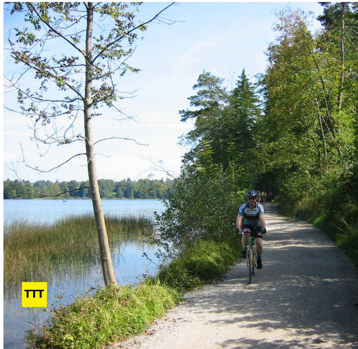
Eine von vielen schönen Passagen bei diesem abwechslungsreichen Bikeausflug: Der Fußgänger- und Radweg am Südufer des Staffelsees.

Es lohnt sich, reichlich Zeit einzuplanen und unterwegs innezuhalten. Nicht nur zum Brotzeitmachen in einem der Biergärten entlang der Strecke. Naturliebhaber kommen beispielsweise bei der Pflanzenvielfalt im Naturschutzgebiet am Staffelsee auf ihre Kosten. Im Loisachmoor zwischen Sindelsdorf und Benediktbeuern bietet sich ein Zwischenstopp an der Vogelbeobachtungsstation an. Und im Hochsommer ist es kein Fehler, Badebekleidung einzupacken.