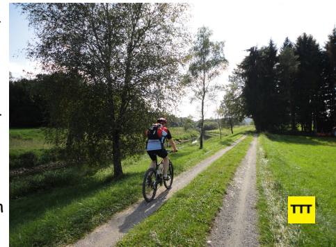
Streckenabschnitt zwischen Loisach und Loisach-Kanal unweit von Oberherrnhausen.

motorisierter Verkehr nur ganz spärlich fließt und die Radler kaum stören wird. Allerdings müssen wir zugeben, dass der Name „Drei-Städte-Tour“ ein kleiner Etikettenschwindel ist. Tatsächlich sehen wir von Bad Tölz, Geretsried samt Gartenberg und Wolfratshausen