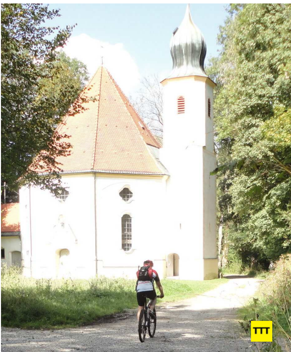
An der Wallfahrtskirche Maria Elend bei Dietramszell.

nur die Peripherie. Dafür ließe sich über ein Bad im Bibisee bei Königsdorf nachdenken. Wie wär's?