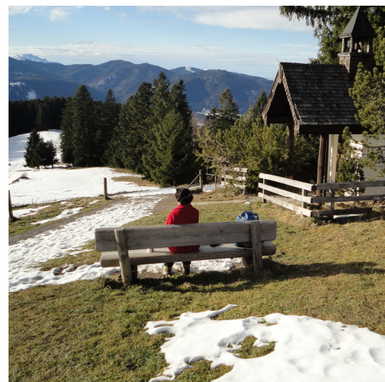
Rast bei der Kapelle an der Neureuth.