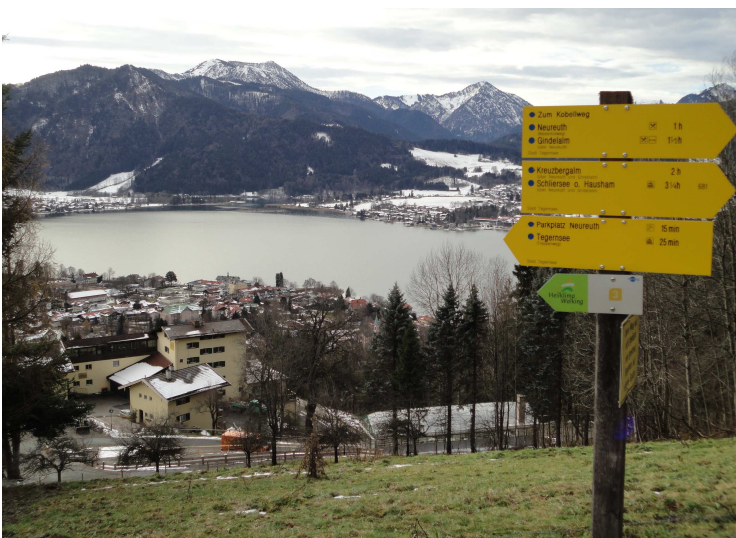
Blick auf den Tegernsee und die gleichnamige Ortschaft.

sind vergleichsweise volkstümlich, wie der Blick in die Speisekarte belegt: Milzwurst gebacken mit Kartoffelsalat 8 Euro, Schnitzel mit Kartoffelsalat 9,50 Euro, Linseneintopf mit Wurst und Brot 7,80, Radler 2,80, Helles 2,90, Weißbier 3 Euro. Montags ist das Gasthaus geschlossen, was den Vorteil hat, dass deutlich weniger Menschen unterwegs sind. Aufgezeichnet haben wir diese Tour übrigens entgegen dem Uhrzeigersinn. Andersherum ist dieser familientaugliche und lawinensichere Ausflug sicher nicht weniger schön.