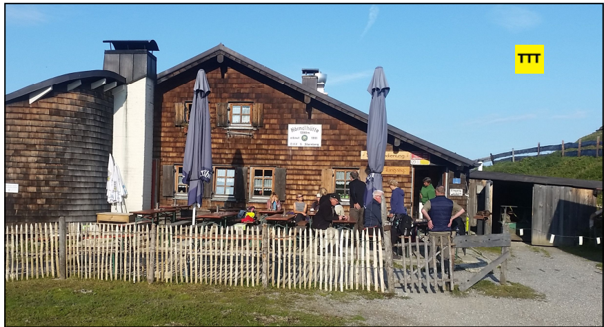
Eine von mehreren Einkehrmöglichkeiten: Die 1911 erbaute Hörnle-Hütte.

Wir wollen Ihnen eine Tour ans Herz legen, bei der Sie mit relativ überschaubarem Aufwand gleich vier Gipfelkreuze „abhaken“ können: Kreuz Nummer eins steht wenige Meter oberhalb der Hörnle-Hütte ( www.hoernlebahn.de ) und dient – nur ein Verdacht – wohl vor allem als Fotomotiv für Menschen, die mit der Bahn herauf gefahren sind, und sich den Weg zum Vorderen, zum Mittleren und zum Hinteren Hörnle ersparen wollen. Wie schade. Sie bringen sich selbst, besonders am baumlosen Hinteren Hörnle, um Ausblicke, bei denen der von den Touristikern gewählte Begriff „gigantisch“ ausnahmsweise mal keine Übertreibung ist. Man kann sich gar nicht satt sehen, beim Blick auf den Staffelsee, aufs Murnauer Moos, hinüber zu Herzogstand und Heimgarten oder zum Hohen Peißenberg und hunderten Gipfeln des Alpen-Hauptkamms. Bei klarer Sicht schaut man bis München und Allianz-Arena.